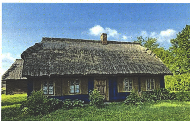
Ryc. 1 Widok obecny budynku nr. 05